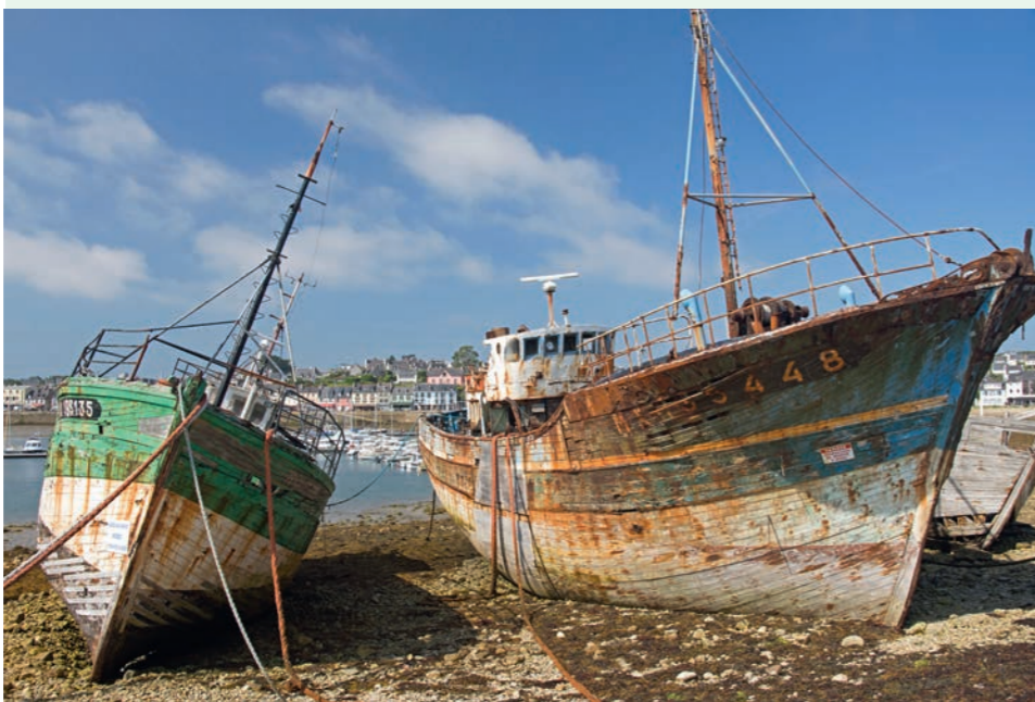
Haven van Camaret.

sen de oude bekenden staan: mooie oesters, anemonen, stekelhooft en purperslak. De grote witte zakpijpen met de romantische naam "Neptunes heart" hebben zwarte naaldjes in de opening, zou het een soort bescherming zijn? Het is voor ons geen nieuw beest, maar wel een leuke ontdekking. De klipvissen en de ijszeesterren zijn er ook. Spinkrabben hebben massaal hun schilden gewisseld, de lege verschalings liggen overal. En ze zijn volop aanwezig, terwijl ze zich normaal uitstekend kunnen verschuilen. Ook de drievinslijmvis is druk in de weer. Het mannetje is knaloranje met een donkere kop en heeft een blauw randje aan de vin. Hij zwemt steeds naar het vrouwtje dat zogenaamd geen interesse heeft. Zij is beige-bruin van kleur en valt me nauwelijks op! Hij gaat steeds naast haar liggen, ik hoop maar dat er kleine visjes van komen... Dat is al een aardige oogst voor een eerste duik.