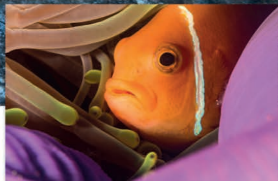
Indrukwekkende scherpe opnamen met de DC2000.

Uit te breiden met "Seadragon" flietsers en verlichting.