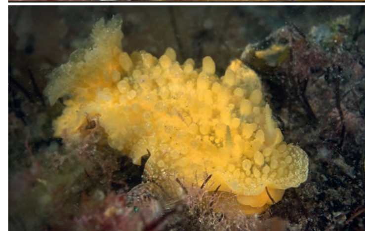
Foto link boven: Het mannetje van de drievinslijmvis. Foto link onder: Sommige slakken zoals deze "sponge slug", overleven bij eb ook boven water. Foto rechts: Overall aanwezig: juweelanemoontjes.