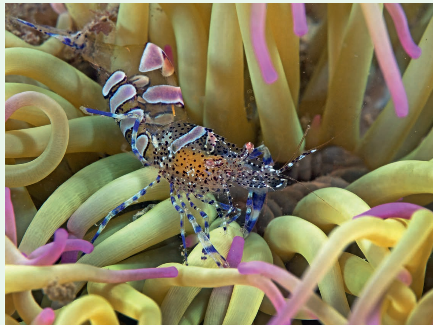
Poetsgamaal in een wasroos.

De tweede duik zwemmen we naar de pijler. Het is even doorzwemmen maar de moeite wordt beloond. Ook al stroomt het hard, achter de pijler is altijd wel een beschut plekje te vinden. Ik val bovenop een sepiaatje. Dat zat onder een touw met hele mooie witte bretelzakpijpjes. Bij de sepia liggen allemaal zwarte brokkelsterren op de bodem. Mijn buddy vindt de hele duik door kleine parende naaktslakjes ( Chromodoris croni ) en platwormen. De grijs gestreepte kende ik al, maar er wordt ook een nieuwe aangewezen, de "Moselyplatworm" (gelukkig kunnen we alle namen vinden in de boeken). De wanden van de pilaar zijn bezaaid met kleine anemoontjes in alle kleuren. Ook op de pilaar zit een heel klein slakje. Bij nader inzien is het de paarse waaierslak ( Flabellina pedata ). Als het priegelslakje gaat lopen wordt het wel wat groter. De jacobsmossel is altijd leuk om te zien. Ze worden natuurlijk veel gevangen, want het is in Frankrijk een delicatessen.