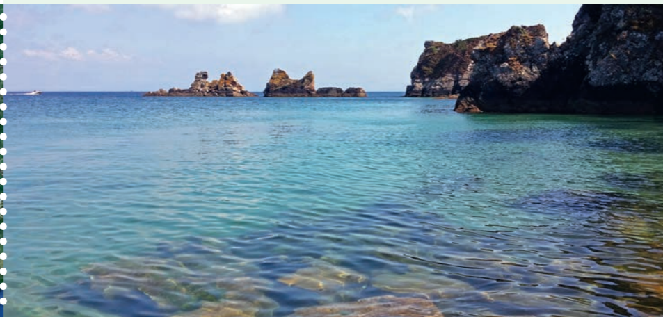
In de smalle zeestraat kan het hard stromen.